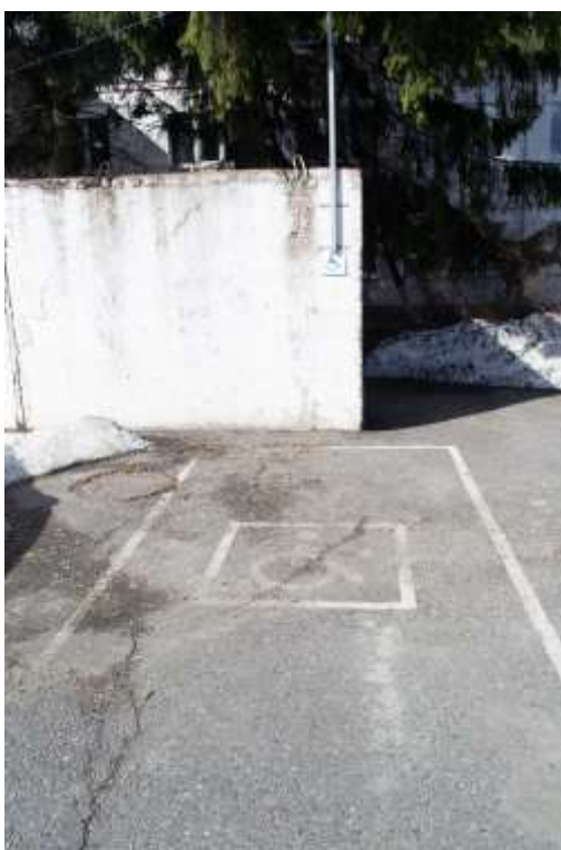
Места для парковки автотранспортных средств инвалидов