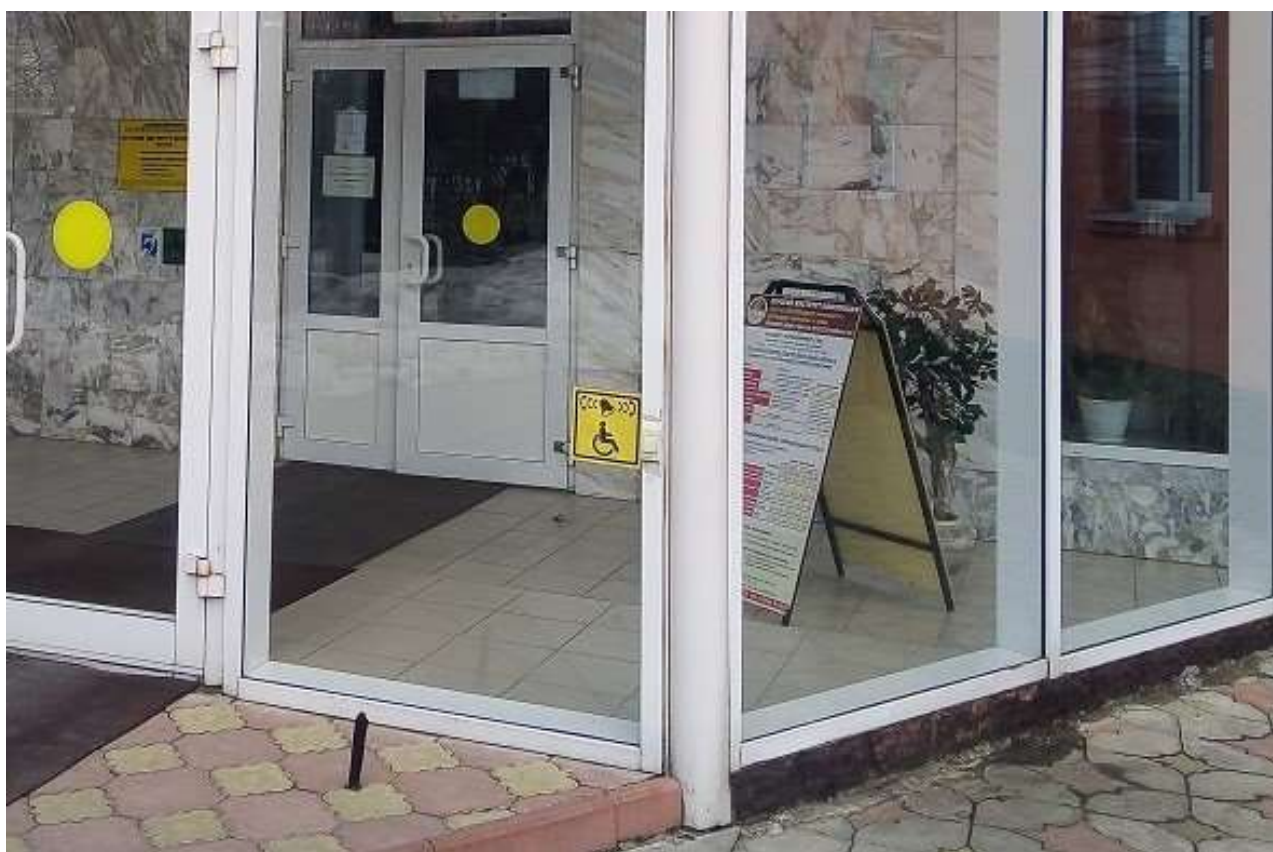
На входе в учебный корпус установлена кнопка вызова сотрудников для инвалидов-колясочников