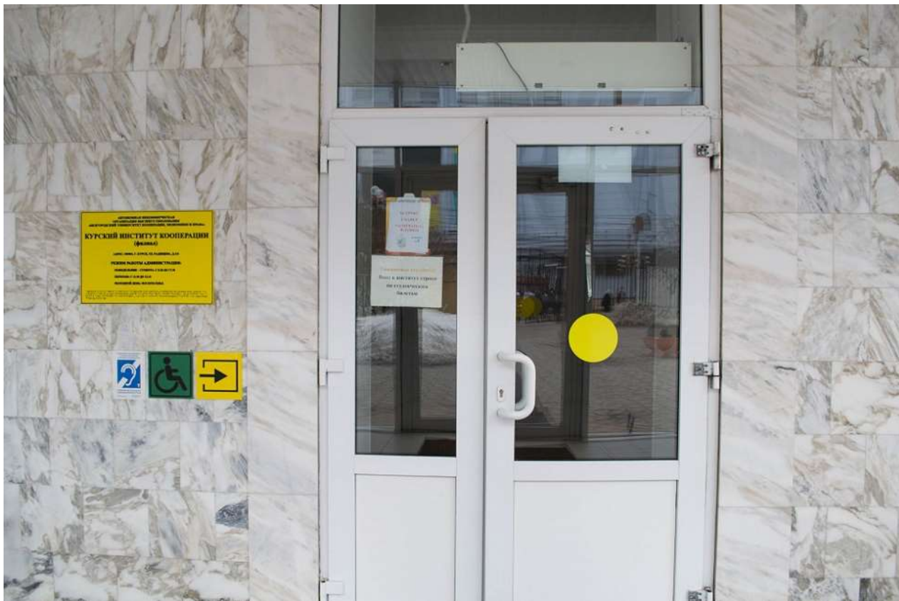
Вывеска с названием организации и графиком работы, выполненная рельефно-точечным шрифтом Брайля и на контрастном фоне